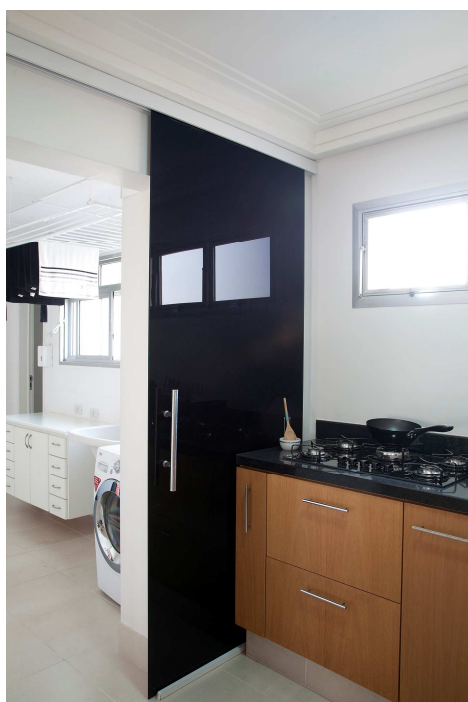
Puxador Linha Ibiza

A Dorma forneceu também o puxador da porta de correr de vidro da linha Ibiza que separa a cozinha da lavanderia que, por ser cilindro e não ter quinas evita lesões em caso de batidas.